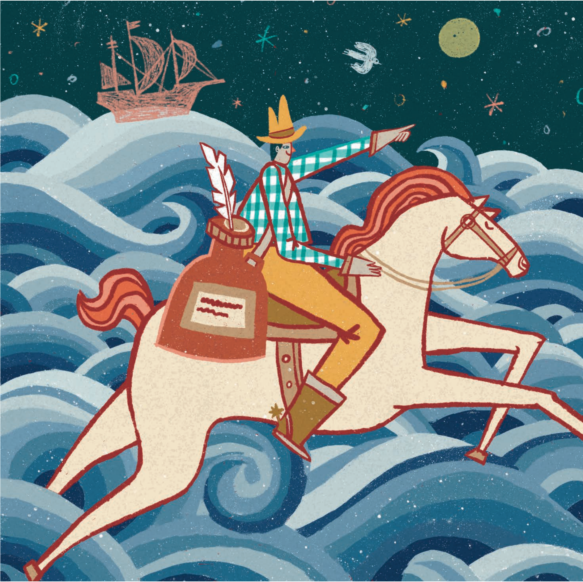
MEMORIAS DE UN ESCRITOR Dibujo digital Jorge A. Chávez Puente